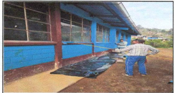
Foto 4: 9, pintura en muros exteriores e inferiores: 9,1 pintada en muros exteriores e inferiores.