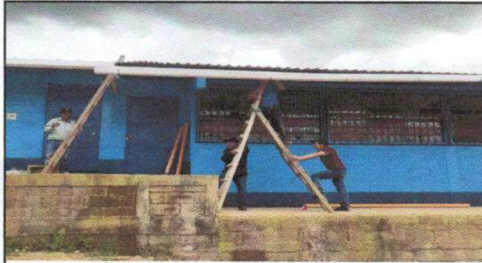
Foto 3: 7, canales y bajadas de agua plubiales: 7,2 sustituciones de canal PVC