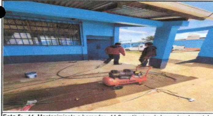
Foto 5: 11, Mantenimiento a barandas: 11,2 sustitución de barandas de metal